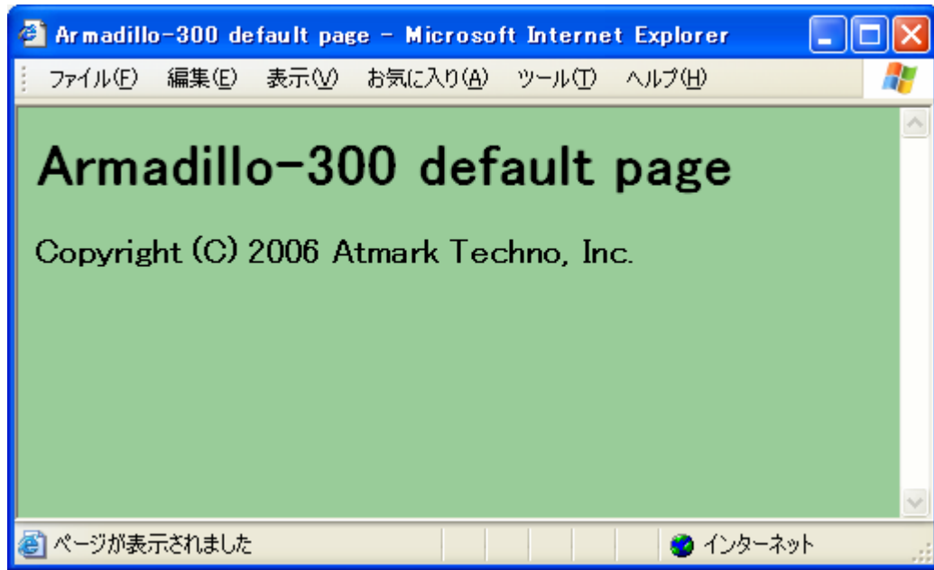
図 6-1 Armadillo-300 のトップページ

Armadillo-300 では、tthttpdという小さなhttpサーバが起動しています。PCのWebブラウザからArmadillo-300 をブラウズすることができます。データディレクトリは「/var/www」です。URLは「http://(Armadillo-300のIPアドレス)/」になります。